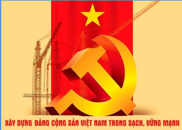
XÂY DỰNG ĐẢNG CỘNG SẢN VIỆT NAM TRONG SẠCH, VỮNG MẠNH

- Công tác xây dựng Đảng về chính trị tiếp tục được chú trọng, tăng cường, tạo nền tảng vững chắc để nâng cao bản lĩnh, tính tiên phong, năng lực lãnh đạo, cầm quyền của Đảng. Kiên định, vận dụng và phát triển sáng tạo chủ nghĩa Mác - Lênin, tư tưởng Hồ Chí Minh; kiên định mục tiêu độc lập dân tộc và chủ nghĩa xã hội; kiên định đường lối đổi mới của Đảng; kiên định các nguyên tắc tổ chức và hoạt động của Đảng.